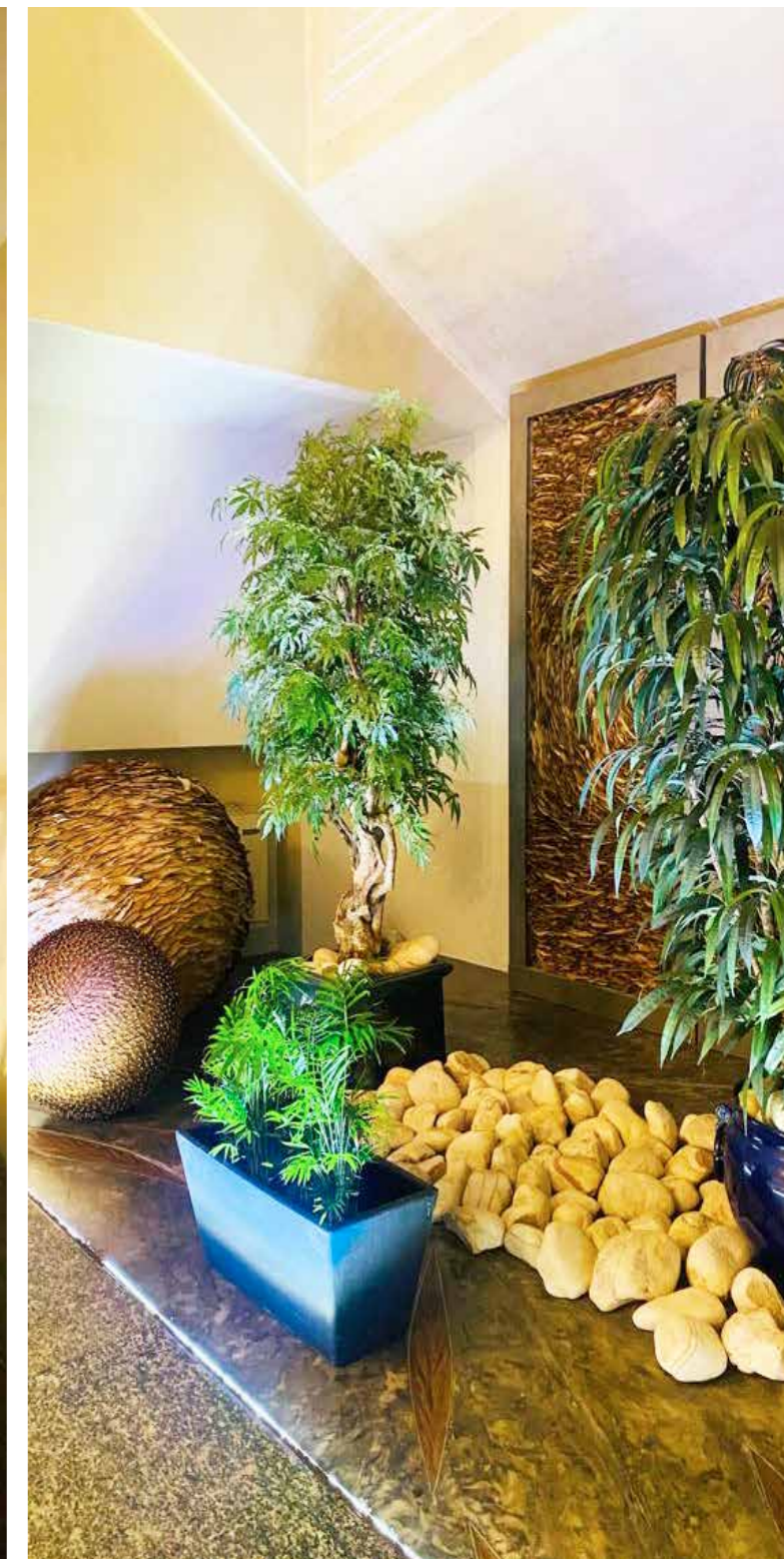
GLI SPAZI INTERNI