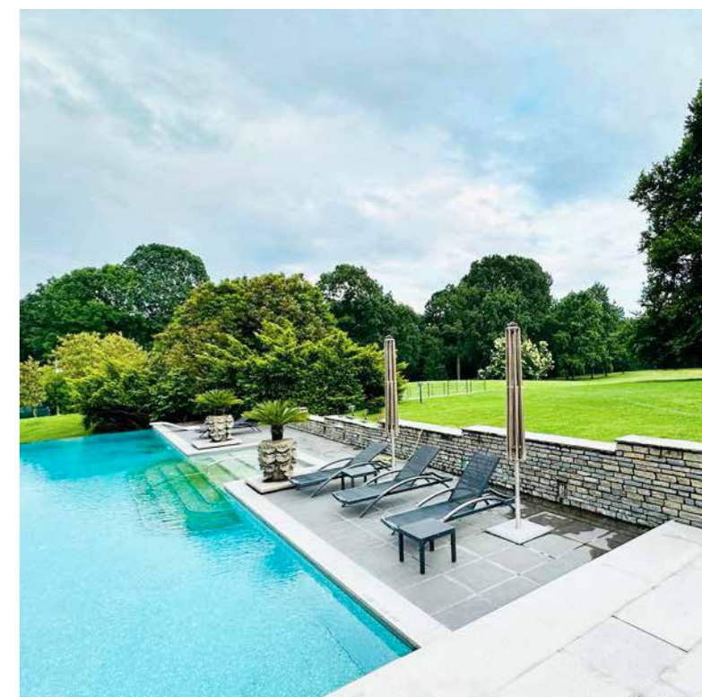
LA SPLENDIDA PISCINA