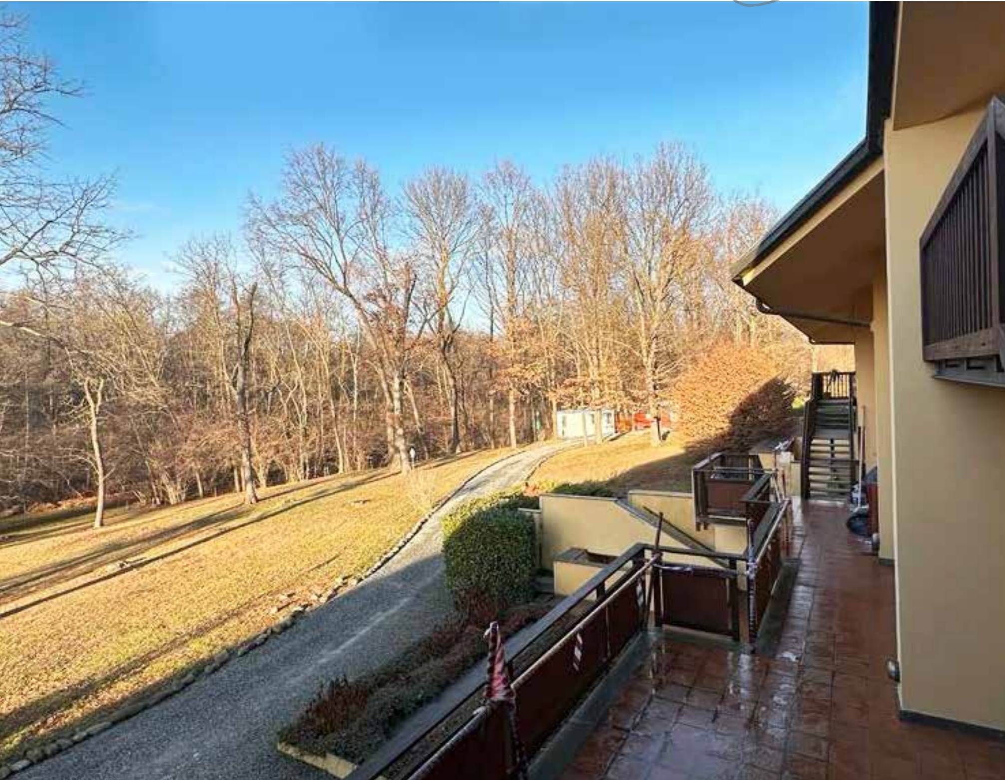
Immerso in un magnifico contesto di prati e piante di roveri