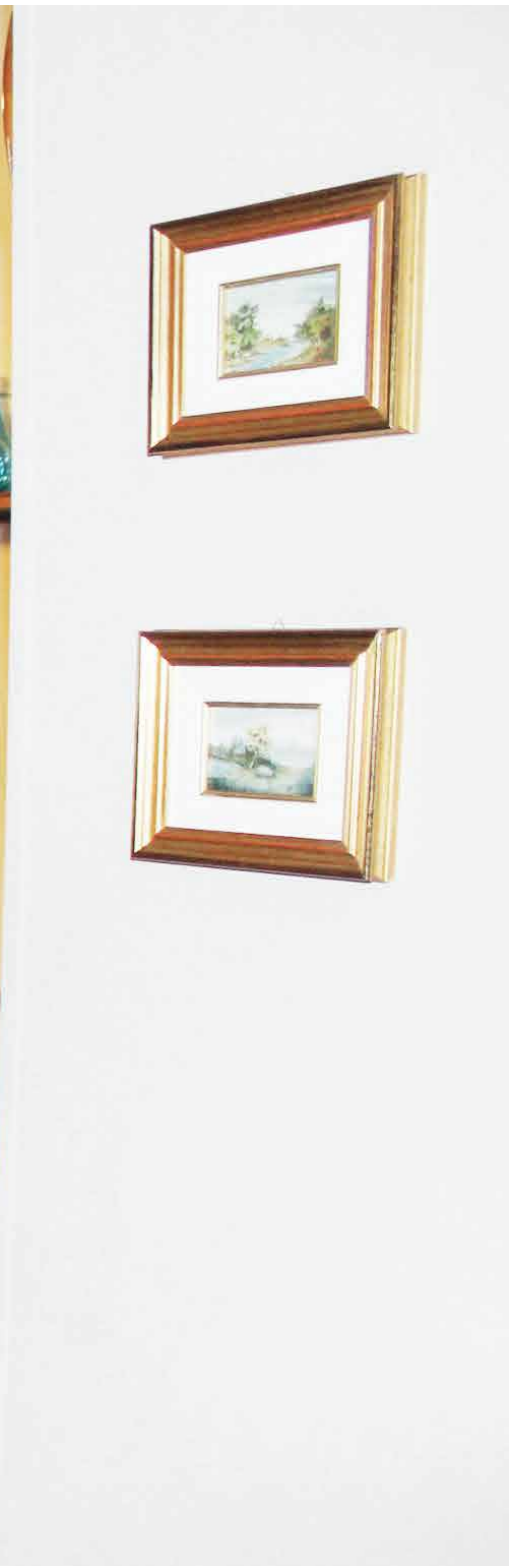
LA ZONA GIORNO ED IL BALCONE