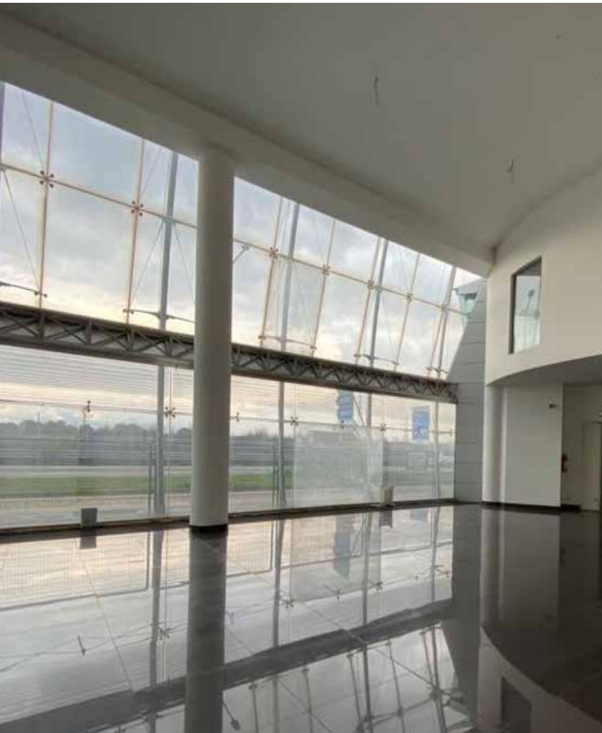
PIANO TERRA COMPLETAMENTE VETRINATO