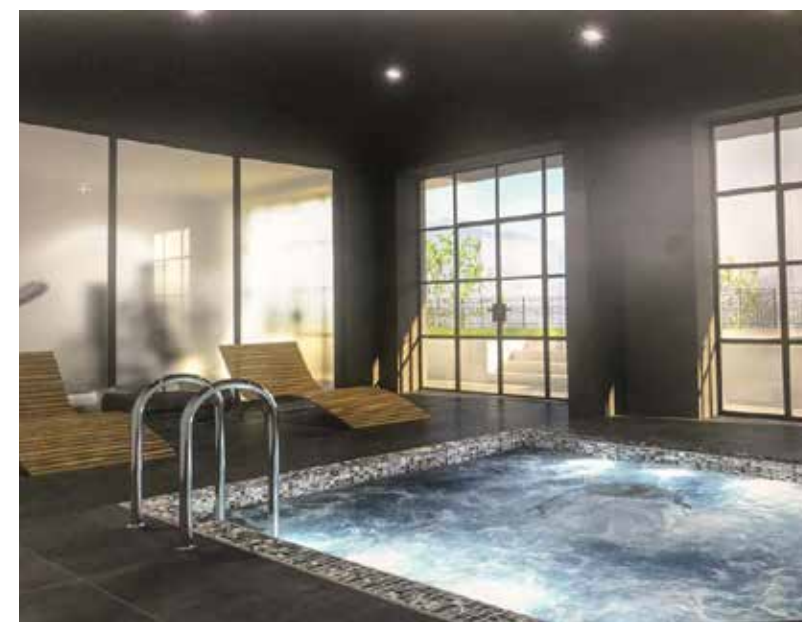
Villa Tarek - Moltrasio