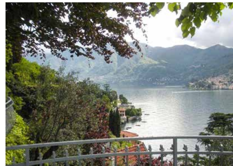
Villa Tarek - Moltrasio